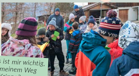
Was ist mir wichtig, auf meinem Weg zur Krippe?