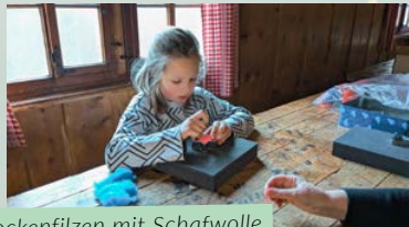
Trockenfilzen mit Schafwolle.