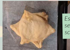
Es muss nicht immer ein Zopf sein, ein gebackener Stern schmeckt ebenfalls köstlich.