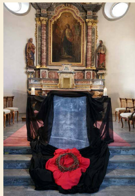
Heiliges Grab in der Kirche Von Freitagvormittag bis Samstagmittag (15. bis 16. April) sind Sie zur stillen Betrachtung am Heiligen Grab eingeladen.