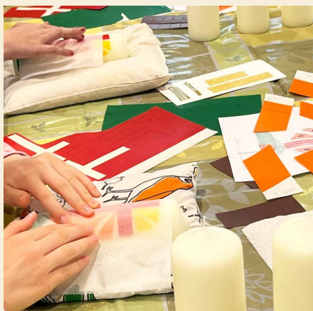
Eine Heimosterkerze entsteht.